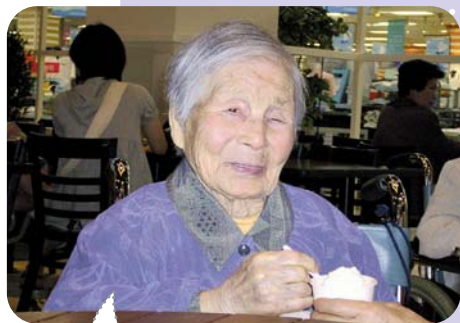
アイスクリームおいしいね～。