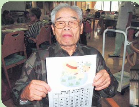
「今はなんでも機械じゃけえ、 あっという間に 植えられるなあ。」