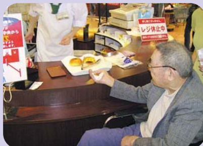
コロケパンのお買い上げ！