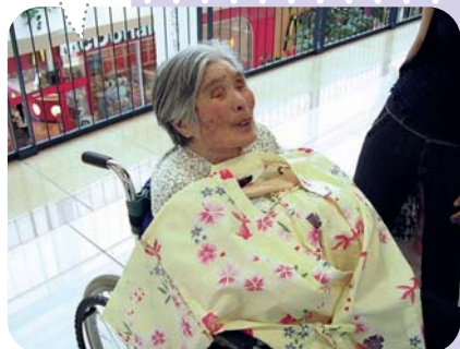
甚平さんもお買い上げー！