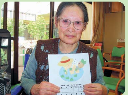
「かわいい作品でしょ。 10月は稲刈りをしましょうね。」