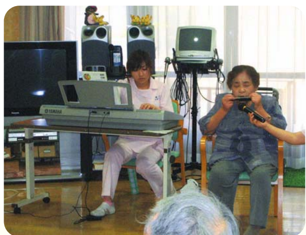
利用者さんによるハーモニカ演奏