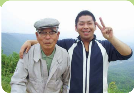
「服部の案内はわりに まかすとけーよ」