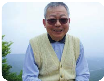
笑顔で「うん、ええよ」