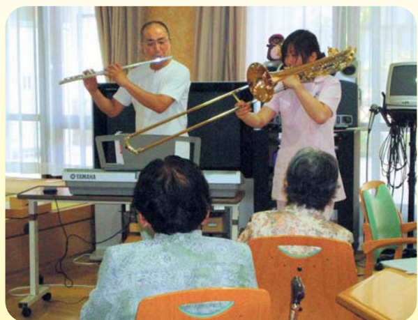
デイの職員によるフルート&トロンボーンの合奏