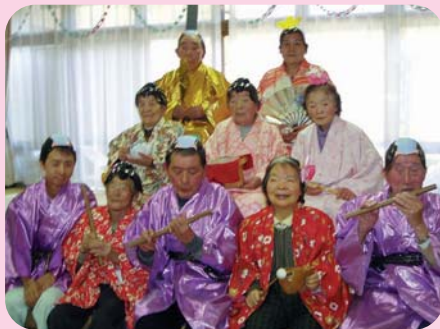
賑やかな雛段ができました。