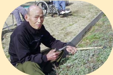
ワシも腰をすえて採るでえ。