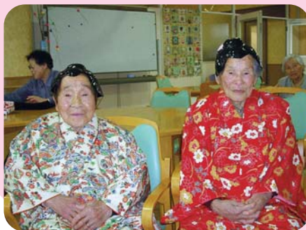
艶やかなお雛様ですね。