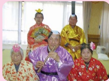
しっとり、うっとり 見とれてしまいました。