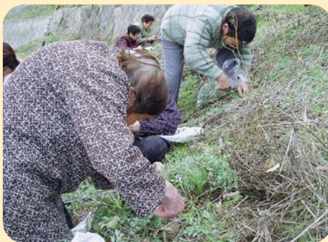
ええ蓬がぎょうさんあるでえ。