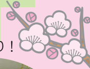
職員による二人羽織り!