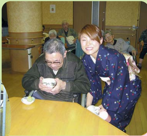
職員も着物に着替えて !!