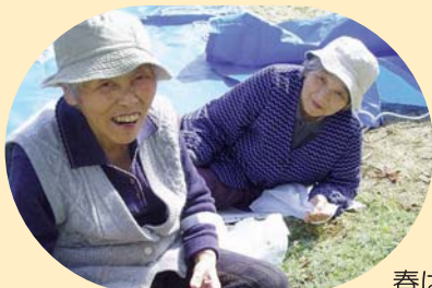
春は気持ちがあえなあ。

【よもぎ】 山野に自生するキク科の多年草。若葉は草もちに、葉の綿毛をもぐさに用いる。モチグサ。