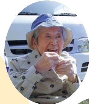
まあ、 ええ匂いが するなあ〜。