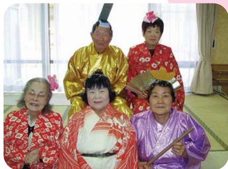
アツアツのお内裏様とお雛様。 三人官女もあてられてしまいましたね。