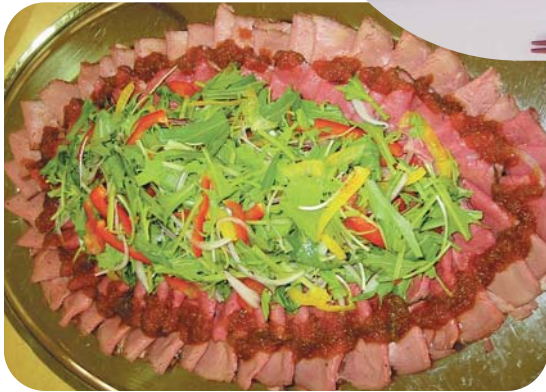
月1回の松花弁当も おいしいですよ！